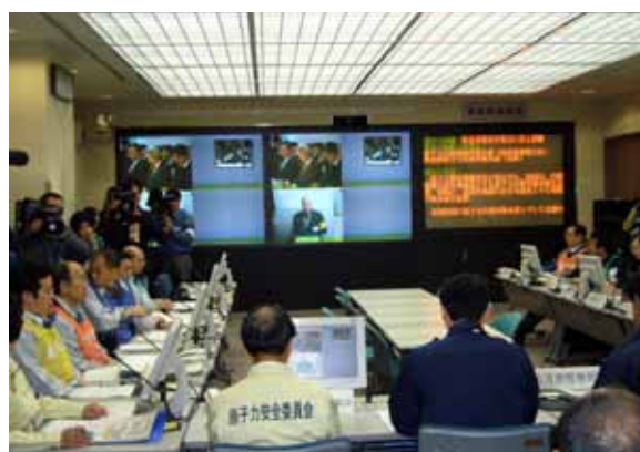
写真1 3地点TV会議 （官邸、柏崎刈羽原子力防災センター、刈羽村役場）