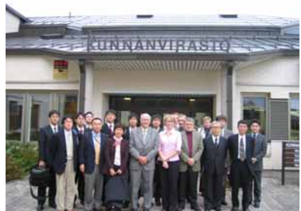
写真1 オルキオ原子力発電所周辺住民との懇談を終えて

オルキオ周辺住民との懇談では、周辺住民を代表して地方議会の議長らと、原子力施設に対する住民への対応などについて議論をしました。原子力事業者やSTUK等の機関が積極的に情報を公開しており、住民に信頼を得ていると説明がありました。