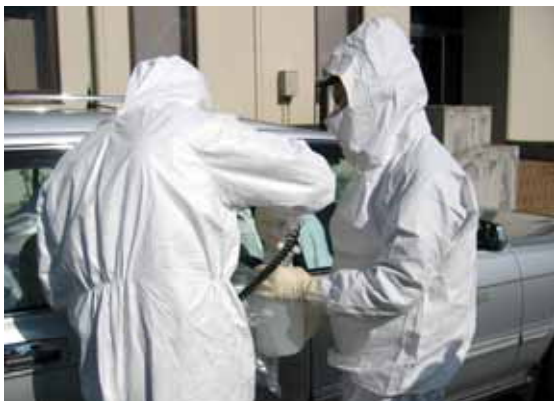
写真2 環境試料の測定（飲料水）

階となっており、第2次配備態勢は原災法第10条に定める特定事象発生時と原災法第15条に定める原子力緊急事態宣言発令時に分けられている。第2次配備態勢からは、環境調査班を編成して、緊急時モニタリングを実施する。環境調査班は、班長（県原子力安全対策課長）をトップに企画情報収集チーム並びにモニタリングの実動部隊を統括するモニタリングセンター長（県放射線監視センター所長）のもと出動管理チーム（総務グループ、被ばく管理グループ）、テレメータ監視・試料測定チーム（テレメータ監視グループ、核種分析グループ）、機動監視チーム（巡回監視グループ、空中・海上監視グループ）及び機動チーム（試料採取グループ、可搬型モニタリングポスト監視グループ、TLD・資機材補充グループ）で構成されている。