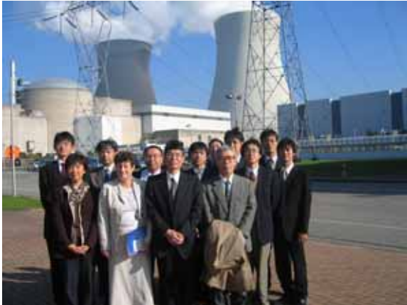
写真2 ドール原子力発電所にて

には連邦政府と結ばれたテレビ会議システム等が整備されており、一連の緊急時対応について説明がありました。